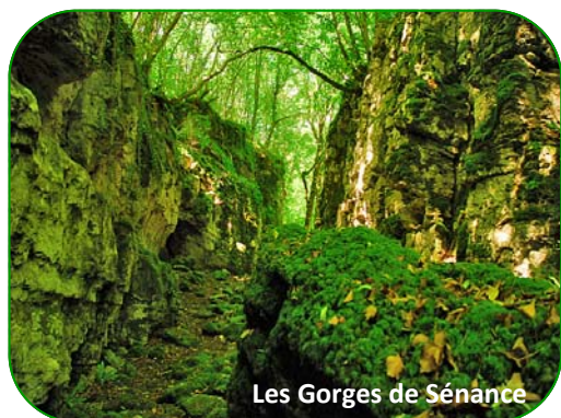
Les Gorges de Sénance

Réalisé entre 1882 et 1889, il recueille les eaux de la Mouche et du Morgon, qui couvrent un bassin de 6 500 hectares, pour une capacité de stockage de 8 648 000 mètres cubes d'eau. La faible emprise des aménagements réalisés en font l'un des lacs les plus "sauvages" du Pays de Langres réservé pour la pratique de la pêche et de la randonnée.