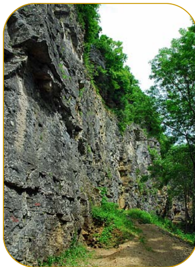
Les falaises de Cohons