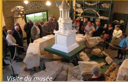
Visite du musée

Il était construit en blocs de grand appareil, assemblés à joints vifs et scellés par des agrafes en fer ou des queues d'aronde en bois. En forme de tour élancée à base carrée d'environ 8 m de côté, il superposait, sur près de 25 m de hauteur, trois niveaux d'ordre corinthien, surmontés d'une toiture, elle-même couronnée d'un grand chapiteau corinthien.