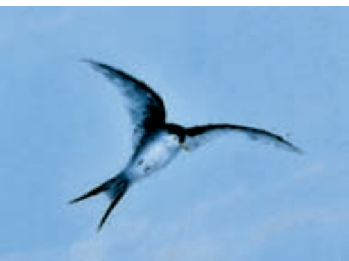
Détail du plafond de la salle des pas perdus.

centre duquel figure une fleur. Dans l'axe de la première volée d'escalier est placé sur le mur du fond un décor sculpté allégorique composé de nombreux objets en relation avec la Patrie et la République (faisceaux éclairés, chaînes ouvertes, cœur enflammé au centre d'un bouclier...). Au-dessus de ces objets, un visage de femme avec une flamme sur la tête et entouré de ceps de vigne est placé sous une horloge réalisée par l'artisan langrois Colin.