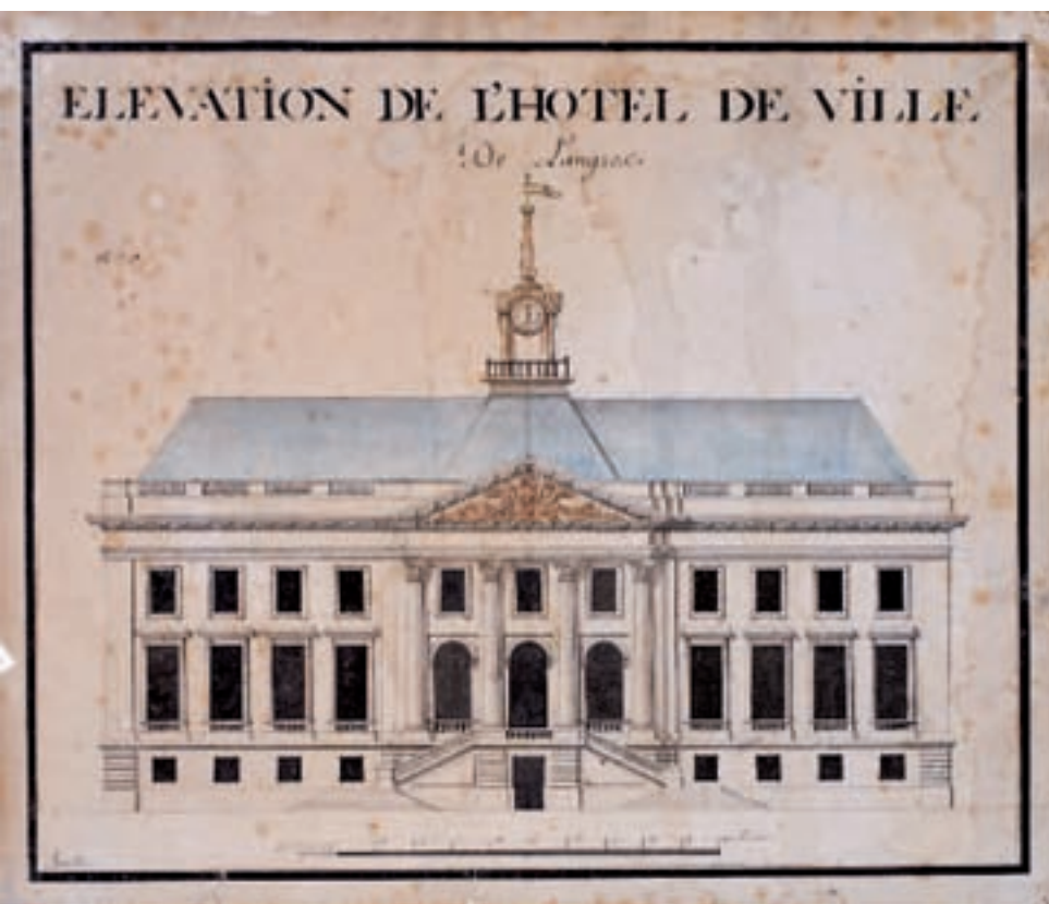
Élévation de l'hôtel de ville de Langres, dessin aquarellé (vers 1770) – coll. Musées de Langres.

Quelques années après sa mise en service, l'hôtel de ville subit son premier incendie le 13 novembre 1786. Le deuxième incendie répertorié date du 6 germinal an III (26 mars 1795). Les dégâts furent