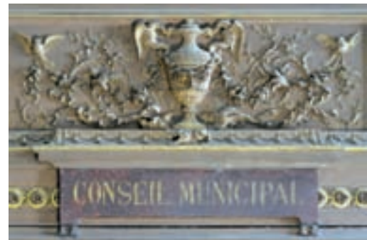
Détail du dessus de la porte de la salle d'honneur.

Claude GILLOT : Né à Langres en 1673, cet artiste très célèbre de son temps a été le maître du peintre Antoine Watteau. Il dirigea les décorations et l'atelier des costumes à l'Opéra. Reçu à l'Académie royale de peinture et de sculpture en 1715, il meurt en 1722 à Paris. La cheminée de style Louis XVI (de même que la cheminée de style Louis XV