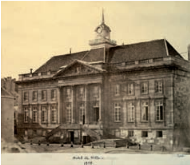
Le clocheton sur la toiture de l'hôtel de ville donnait un aspect beaucoup moins massif au bâtiment. Photo de Victor Petit (1858) – Coll. Musées de Langres.