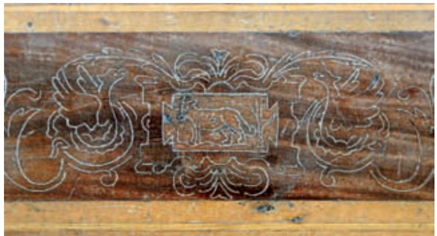
Détail de la marqueterie autour de la pierre de cheminée de la salle d'honneur. La marque de l'artisan Leloup est visible au centre du cartouche.

Sur la cheminée de la salle d'honneur trône une copie en plâtre du buste de Denis Diderot réalisé par le célèbre