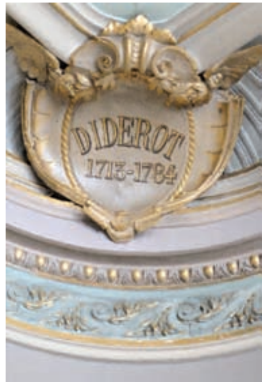
Détail de la salle d'honneur.

dans le cabinet du maire) a été fournie par le quincaillier langrois Joblon-Gy. La remarquable marqueterie au sol autour de la pierre de cheminée présente des motifs de « rose des vents » et un décor de cartouches hexagonaux. A l'intérieur de ces cartouches figurent : Dans celui de gauche, la date de réalisation de la marqueterie et par