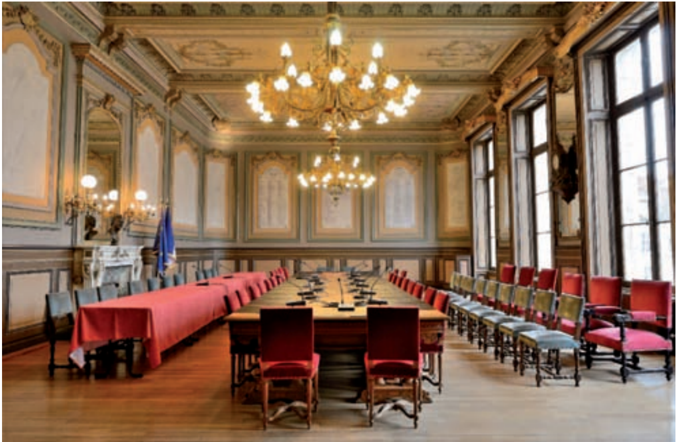
Salle d'honneur (ou salle du conseil municipal).

extension de la salle. L'ensemble de l'hôtel de ville réaménagé est inauguré le 5 mai 1895.