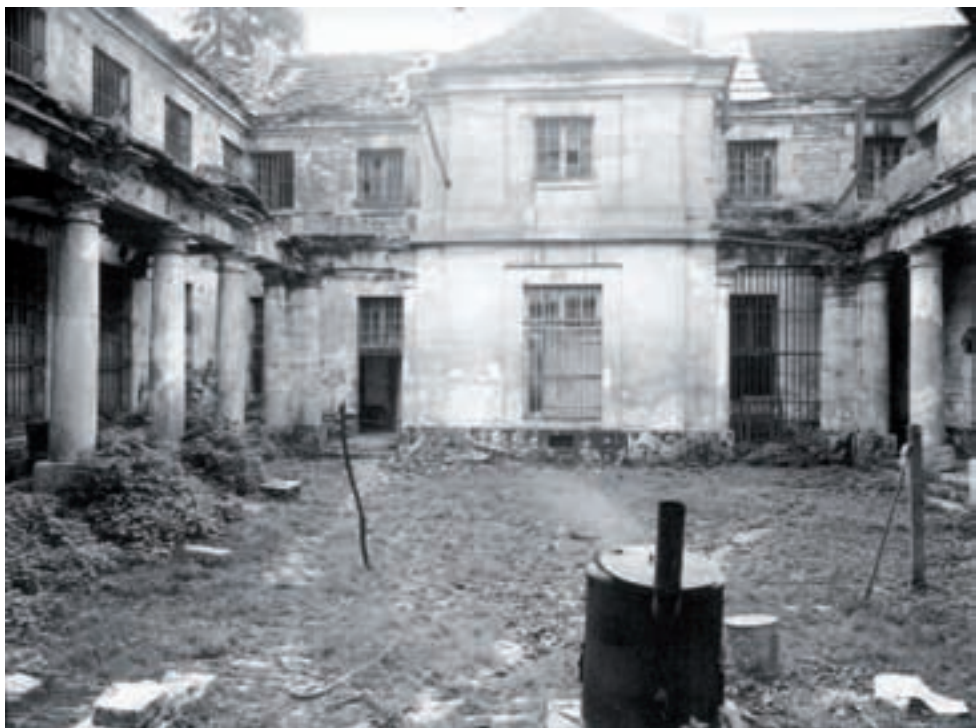
Cour de la prison avant sa destruction (vers 1960).