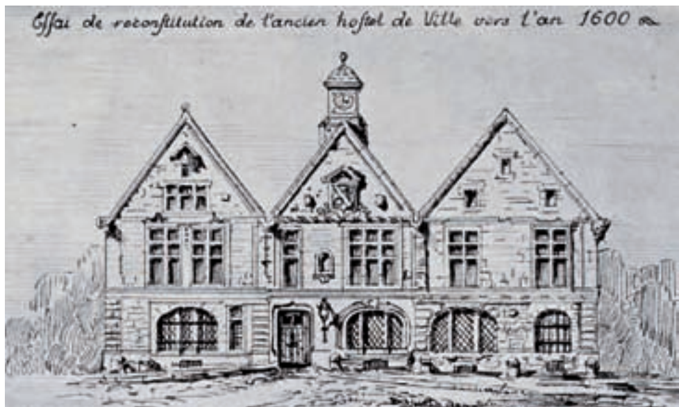
Essai de reconstitution de l'ancien hôtel de ville d'après les descriptions existant dans les archives par E. Meot (1937) – coll. Musées de Langres.

Sous le règne d'Henri III en 1581, et là encore à la demande des habitants, la dénomination de procureur est