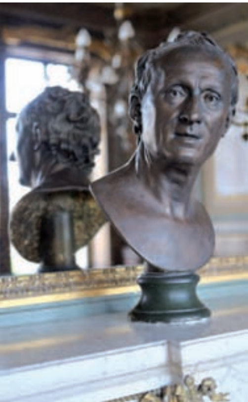
Copie du buste de Diderot d'après Houdon sur la cheminée de la salle d'honneur.

sculpteur François Houdon. L'original a été donné à la ville par Denis DIDEROT en 1780. Il est conservé et exposé au musée d'Art et d'Histoire. Ce buste représente Diderot « à l'antique », comme un philosophe romain la tête nue, le torse tronqué et sans habits ni draperie. L'intensité du regard est rendue par un petit élément en relief qui dépasse sur la pupille et capte la lumière, donnant l'impression de la vie. L'animation est donnée par la position de la tête, tournée vers un interlocuteur invisible avec qui le philosophe semble converser.