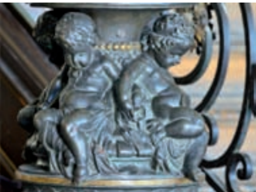
Détail de l'escalier d'honneur.