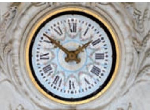
L'horloge située dans l'escalier d'honneur.