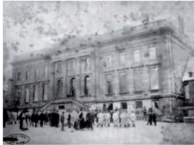
Photo prise après l'incendie de l'hôtel de ville.

importants puisque le compte-rendu des séances de l'Administration du District et des autorités précise que « le feu a consumé la chambre du Conseil qui formait le bureau de la municipalité ainsi que les archives où il a fait beaucoup de dégâts. »