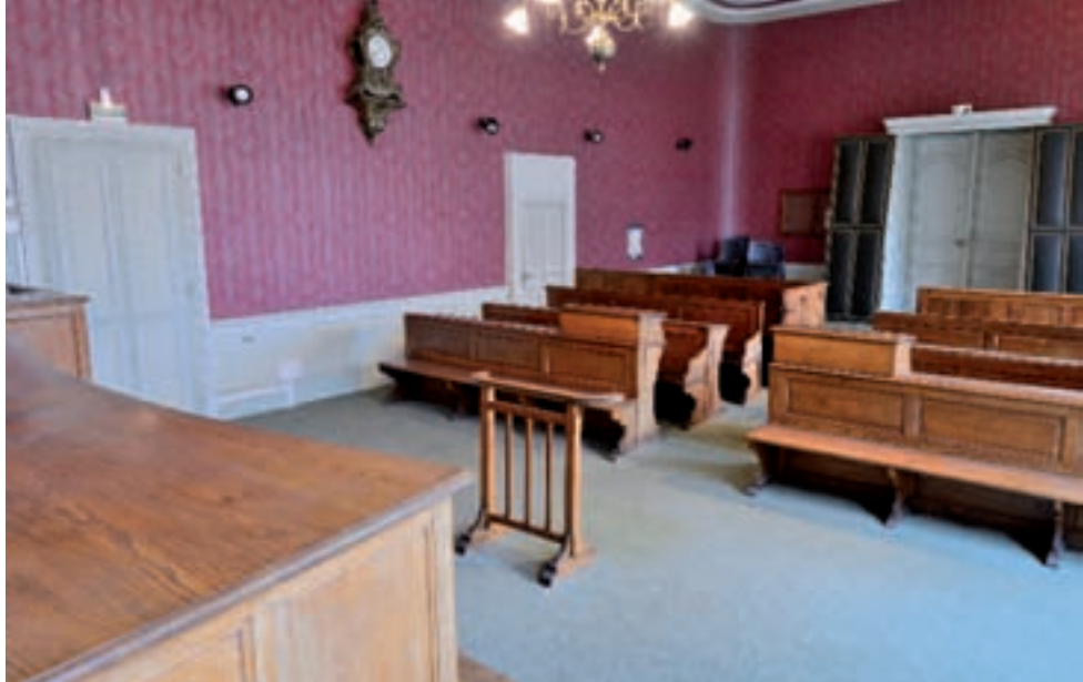
Ancienne salle du tribunal.