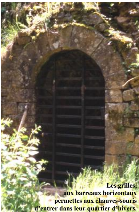
Les grilles, aux barreaux horizontaux permettent aux chauves-souris d'entrer dans leur quartier d'hivers.

Les accouplements de Chauves-souris ont lieu en automne dans les gîtes de mise bas ou de transition. La fécondation des femelles est différée pour la plupart des espèces. Elle est déclenchée par le réveil après l'hibernation : la femelle conserve en elle le sperme du mâle pendant tout l'hiver et au printemps se produit l'ovulation et la fécondation. La gestation dure environ 2 mois, la période est variable selon les conditions climatiques. La mise bas se produit en juin dans des gîtes. Les femelles se regroupent en colonies de reproduction, les mâles étant isolés. En général, une femelle n'a qu'un petit par an. L'élevage a lieu pendant la période estivale. Les mères laissent les petits aux gîtes pendant qu'elles s'alimentent ; à leur retour, elles les reconnaissent à leurs cris et à leur odeur. En cas de danger, la colonie peut se déplacer vers un lieu plus tranquille ; pour cela les mères s'envolent avec leur petit accroché à leur pelage ou à leurs mamelles. Il est impératif de ne pas déranger la colonie pendant ces périodes, en particulier pendant la gestation, car les femelles risquent d'avorter. Les comptages sont réalisés à l'aide d'un détecteur d'ultrasons mais peuvent être réalisés également comme en hiver par comptage visuel quand le site s'y prête.