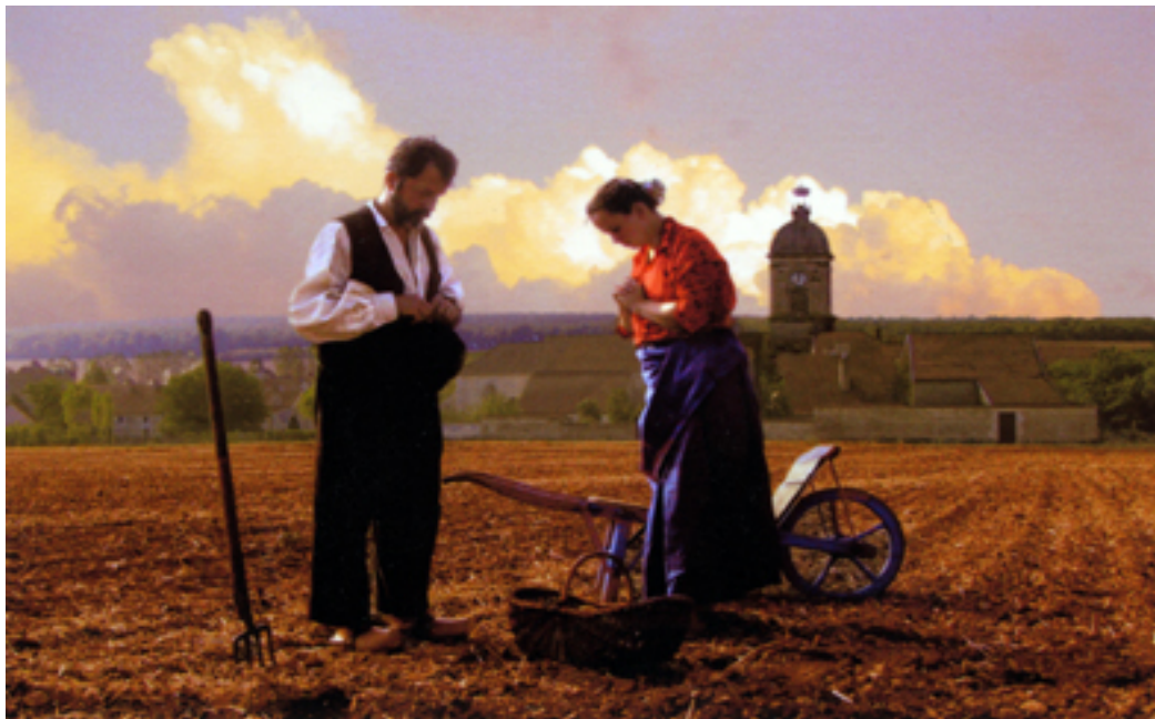
« L'Angélus à Dancevoir d'après Millet »